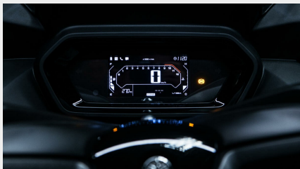
Tableau de bord LCD de 4,3 pouces

Le XMAX 300 est équipé d'un nouveau tableau de bord LCD élégant de 4,3 pouces qui affiche l'état de la machine et les informations de fonctionnement dans un format clair et facile à lire. Le compteur de vitesse numérique, situé au centre de l'écran, est surplombé par un compte-tours à barres, et de chaque côté, se trouvent des icônes pour le carburant et la température du moteur.